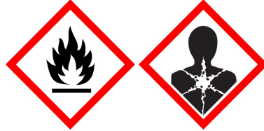
Immagine di pericolo: